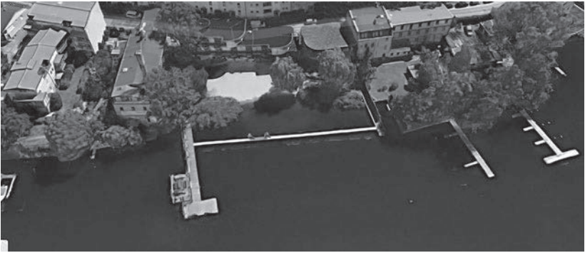
Das Flussbad Gartenstraße am Frauentog