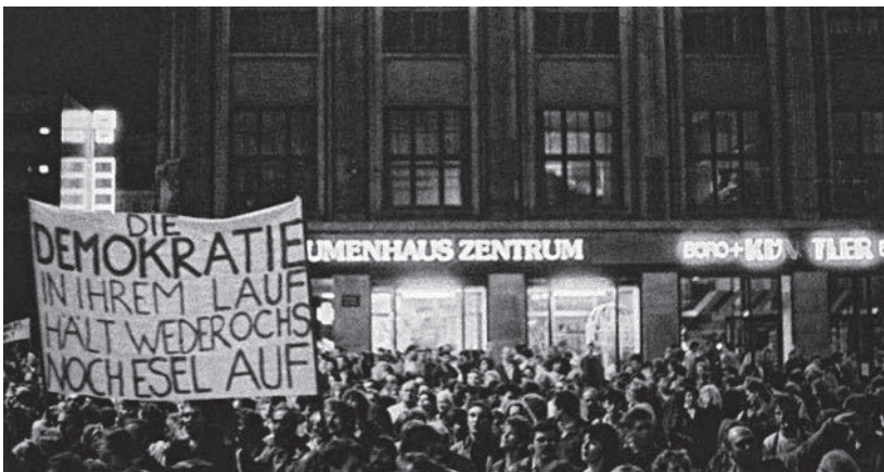
Die Montagsdemos läuten die Friedliche Revolution in der DDR ein.

Beim Betreten ihrer Wohnung fand sie im Flur einen Zettel mit einer Notiz ihres Sohnes: „DDR macht die Grenzen auf – Näheres in den