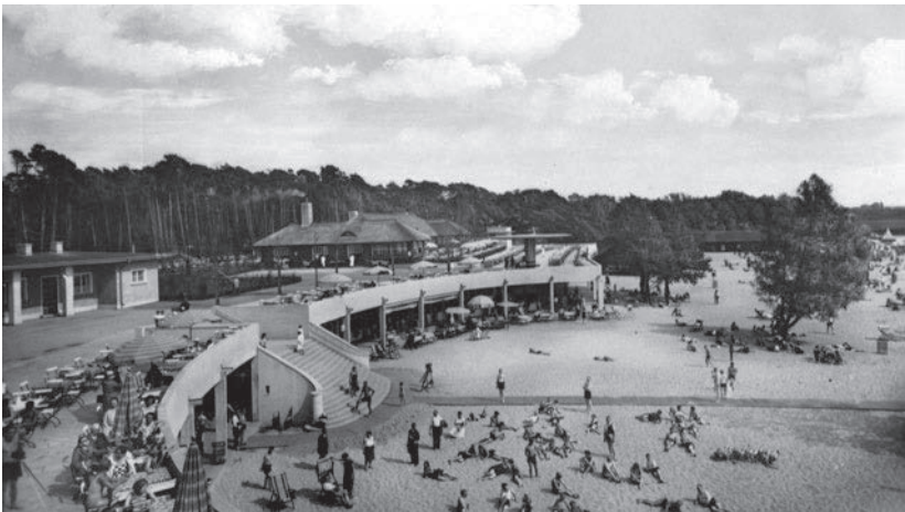
Das Strandbad Müggelsee in Rahnsdorf in den 1930er Jahren

Das Flussbad in der Gartenstraße erfreute sich bei den Kindern besonderer Beliebtheit, weil es für sie schnell erreichbar war. Besuche