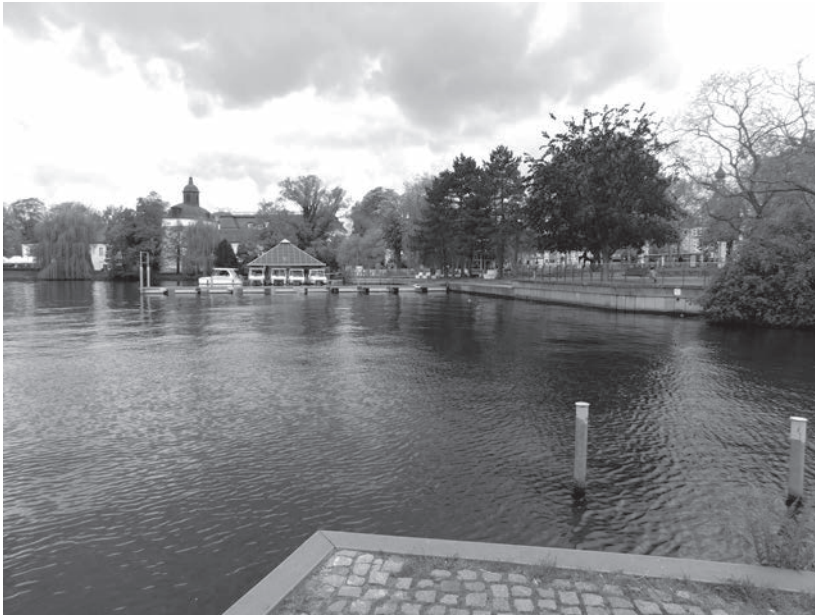
Am Frauentog – Blick auf die Schlosskirche und die Promenade

noch mit der richtigen Atmung und den gleichmäßigen Schwimmbewegungen Schwierigkeiten. Schon in der 2. Klasse legte er im Flussbad in der Gartenstraße den Frei- und Fahrtenschwimmer ab.